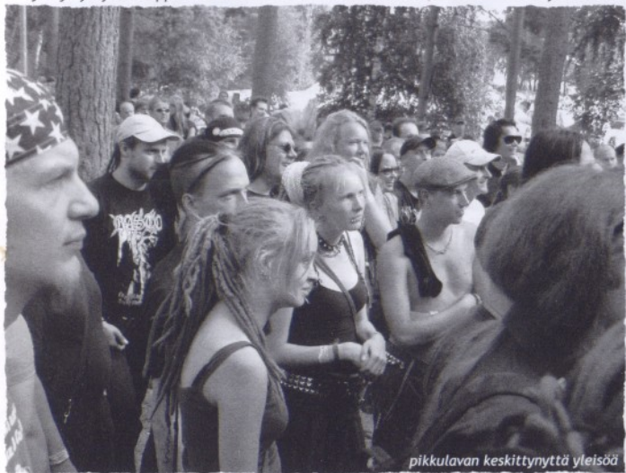
pikkulavan keskittynyttä yleisöä

[PS. Puntalan mainosbudjetti oli muuten Oe: vain ilmaskoopioita+vaihtomainokset TV:ssä]